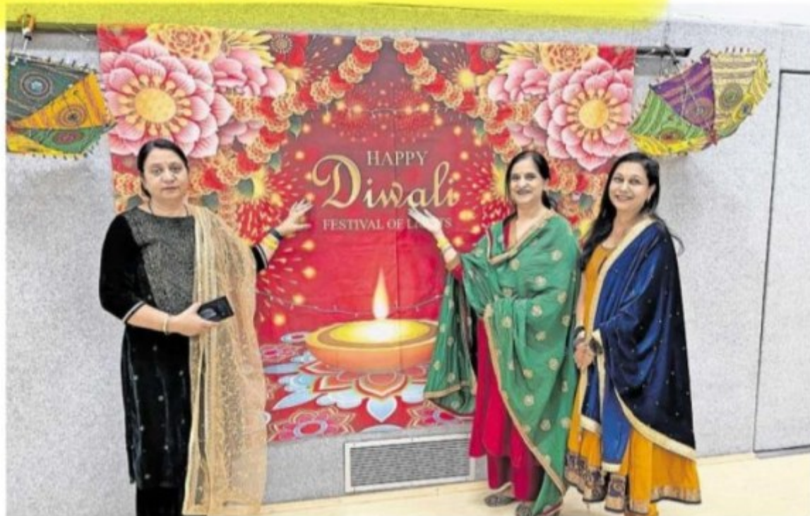
In Duisdorf feierte die Deutsch-Indische Gesellschaft Bonn das indische Lichterfest mit Tanz, Musik und traditioneller Kleidung.