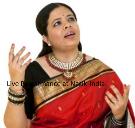
Live Performance at Nasik-India